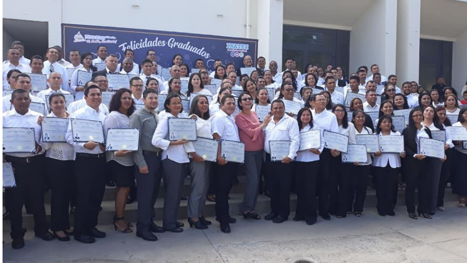
Primera promoción de docentes año 2018