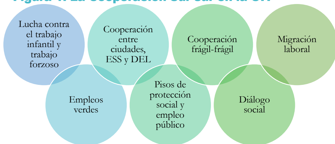
Figura 1. La Cooperación Sur-sur en la OIT

La OIT actúa como mediador, agente de conocimiento, constructor de alianzas y analista de la cooperación Sur-Sur y triangular de un determinado país en el contexto de la Agenda de Trabajo Decente. Este compromiso se pone en práctica mediante la facilitación de actividades para mejorar el diálogo social; la investigación, la identificación y difusión de buenas prácticas; el desarrollo de plataformas web que fomentan las interacciones de intercambio de conocimientos en línea para mantener a los agentes de cooperación Sur-Sur y triangular actualizados; la mediación en los procesos de creación de asociaciones; y la facilitación de foros de intercambio de conocimientos y actividades de aprendizaje de igual a igual, entre otros.