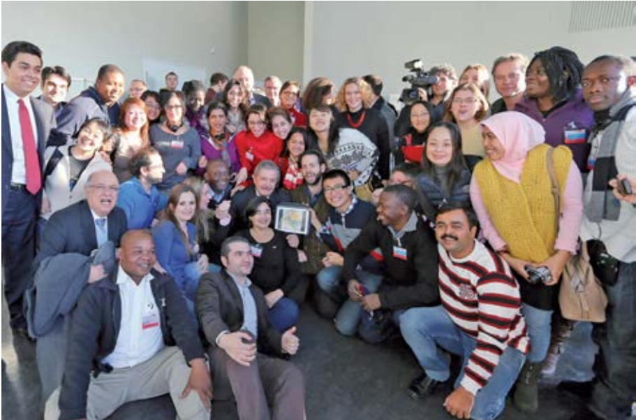
Ex presidente de Brasil, Luís Inácio Lula da Silva, apoya una actividad de GLU.